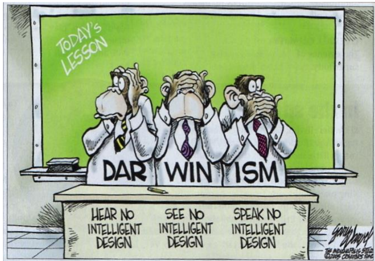
Bilde 5 Når en ikke har interesse av å sanse Fra:

Et siste eksempel på at en ateist offentlig har fornektet noen spenning mellom Gud og Darwinisme, er vitenskapsjournalist I. Fra en bok i 2009: Unscientific America: «How Science Illiteracy Threatens our Future», argumenterer I at "ateisme er ikke det logisk uungåelige resultat av Darwisme, fordi en mengde vitenskapsmenn tror på Gud uten noen følelse av indre motsetning, like så mange religiøst troende aksepterer