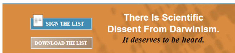
Bilde 4 Trenger ikke være mot vitenskap for å dissentere fra Darwinisme