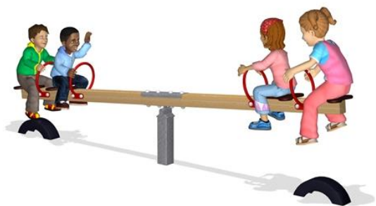
Bilde 6 Kjøttvekta avgjør

Så selv om I har satt merkelappen 'vitenskapelig kjennskap' på kampanjen sin, så synes han å ha satt en strategisk kurs for å minke religionens betydning og styrke a-teistisk vitenskap. Han tilkjenner denne holdningen når han omtaler observasjonen av "mange studenter som studerer evolusjon vil finne at de stiller seg spørrende til den religion de vokste opp med." I en blogg-post i 2009 skrev han: "Jeg tror det er veldig sant, og i det hele til det gode 30 ." Han tilkjenner også hvorfor han spiller en mer forsonende rolle i dag: "Jeg har endret min vektlegging. Mye lesing i filosofi og historie har endret meg i en mer formildende rolle. Det har også enkel pragmatisme gjort 31 ." Lik enhver god politisk strateg, forsøker ateister i NCSE-lobbyen å innsmigre seg hos middel-klassen, de religiøst moderate, i håp om å øke sin tilhengerskare."