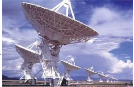
Bilde 3 Søking etter intelligente signaler http://theviewspaper.net/the-search-for-extraterrestrial-life-%E2%80%93-is-it-worth-it/