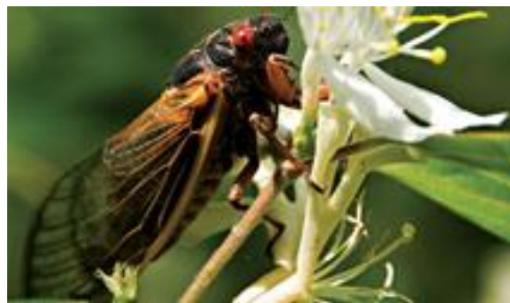
Bilde 1 Sikaden Brood II

Når entomologer studerer insekter og edderkopper, oppdager de ofte eksempler på matematiske evner knyttet til disse små leddyrene. Noen insekter nettopp teller år. Innbyggere på USAs østkyst forventet våren 2013 en sikade-invasjon. Den våren markerte 17 år siden et bestemt kull av en unik form for røddøyd sikade sist dukket opp i hopetall. De kalles også "magicicada" som henspiller på hvordan disse insektene på magisk vis synes å vises samtidig , etter 17 år som larver under jorden.