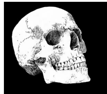
Bilde 2 Homosapiens

Den kjente biologen Ernst Mayr gjenkjente vår plutselige tilsynekomst da han i 2004 skrev: «De tidligste fossilene til Homo: rudolfensis og erectus, er atskilt fra Australopithecus av et stort utildekket gap. Hvordan kan vi forklare denne tilsynelatende plutselige forandringen? Uten å ha fossiler som kan tjene som missing-links, må vi falle tilbake på den utprøvde metode med historie-fortelling» 12 . Som en kommentator foreslo, impliserer bevisene en «Big bang teori» i tilsynekomsten av vår Homo- slekt 13 .