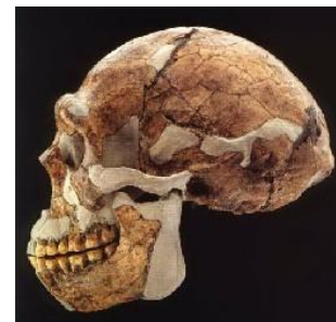
Bilde 1 Homo erectus

I 1998 bemerket en artikkel i Science at for ca. 2 mill. år siden, startet et dramatisk forløp for kraniekapasiteten til Homo-slekten, som resulterte i omtrent en dobling av hjerne-størrelse. » 2 Det påfølgende år publiserte Wood og Collard oversikt i Nature at ett enkelt trekk blant individuelle hominid-trekk kvalifiserte som «mellomledd» mellom Australopithecus og Homo erectus: hjernestørrelsen til Homo erectus 3 . Imidlertid gir ikke dette trekket noe bevis for at Homo-slekten utviklet seg fra mindre intelligente hominider. De forklarer: «Relativ hjerne-størrelse grupperer ikke fossilene på samme vis som andre variable. Dette mønsteret viser at lenka mellom relativ hjerne-størrelse og tilpasnings-sone er et komplekst emne. » 4